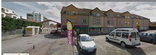
Notre local se trouve derrière ce bâtiment après le passage du porche visible à gauche de cette photo